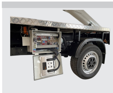
Standardisierte, elektrische Architektur.