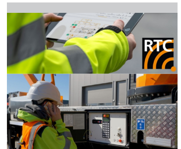
Remote-Überwachung über RTC (Real TIME Connect)